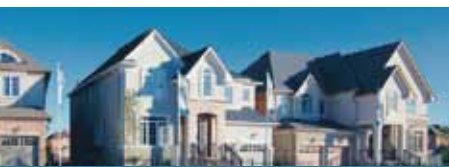
2. ローズハイブ・ホームズ

ナイアガラ・エステート・オブ・チパワIIは、オンタリオ州ナイアガラ地区ナイアガラ市に所在する約47エーカー(約57,540坪)規模の住宅地に適した優良物件