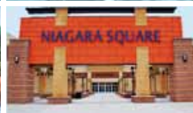
7. ナイアガラ・スクエア・モール