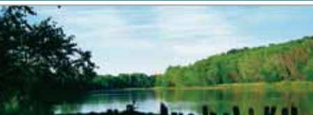
4. チパワ・ボート係留場