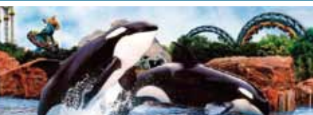
6. マリンランド水族館