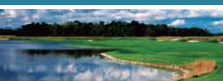
5. レジェンド・ゴルフ