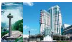
10. スカイロン・タワーとフォールズビュー・カジノ

免責条項:本資料は、情報の提供のみを目的としています。本資料に含まれている情報・データについては、正確を期しておりますが、保証されているわけではありません。TSIインターナショナル・グループの書面による承諾無しに、この資料の複製、第三者への配布又はいかなる書類や資料への掲載又は転記は禁止いたします。