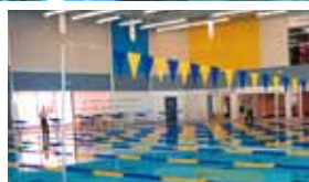
8. ナイアガラ・コミュニティ・センター