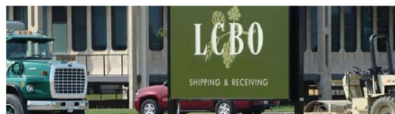
7 酒類物流センター