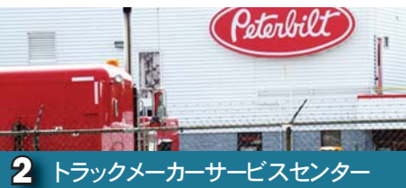
2 トラックメーカーサービスセンター

グリーンバレー・エステート II インクは、オンタリオ州ロンドン市に所在する約66エーカー(約80,800坪)規模の住宅分譲に適した優良物件