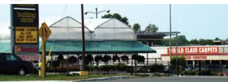
6 ショッピング・モール