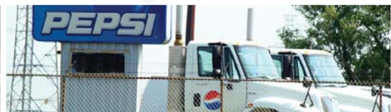
8 ソフトドリンク物流センター

免責条項:本資料は、情報の提供のみを目的としています。本資料に含まれている情報・データについては、正確を期しておりますが、保証されているわけではありません。TSIインターナショナル・グループの書面による承諾無しに、この資料の複製、第三者への配布又はいかなる書類や資料への掲載又は転記は禁止いたします。